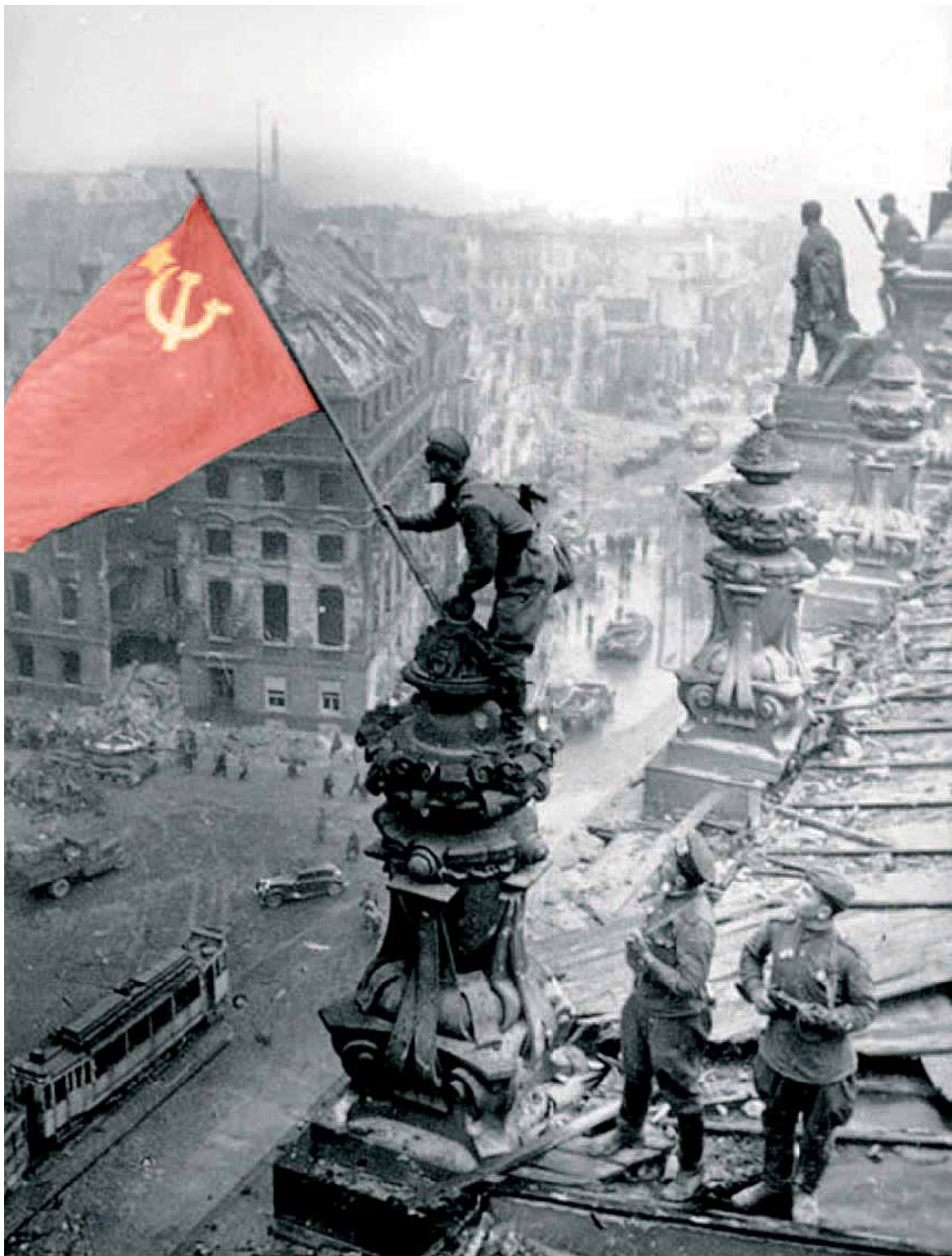
Водружение флага СССР над Рейхстагом, 1945 год